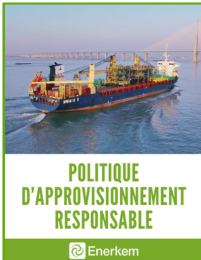
Première politique d'approvisionnement responsable d'Energkem

Energkem a rédigé sa première politique d'approvisionnement responsable en 2024, qui s'appuie sur les valeurs fondamentales et les processus internes de l'entreprise. Elle a été officiellement adoptée par la direction en 2025.